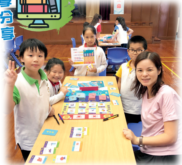
▲師生一起參與桌上遊戲，讓學生學習理財概念，例如分辨「需要」和「想要」。