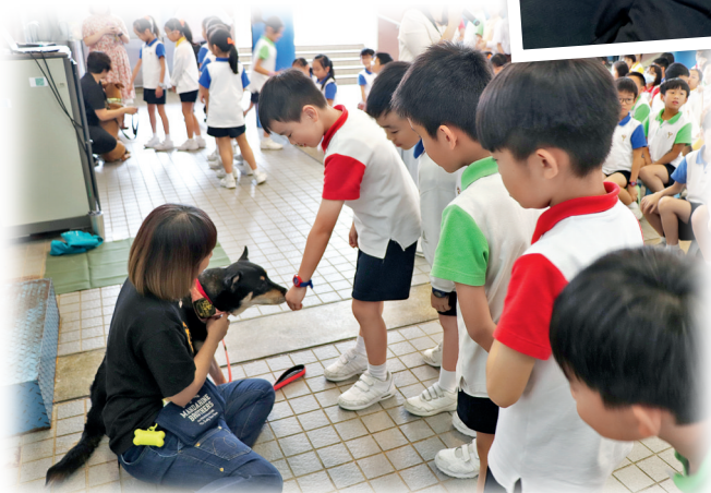
▲學生透過「親親唐狗」活動學懂珍惜生命，愛護動物。