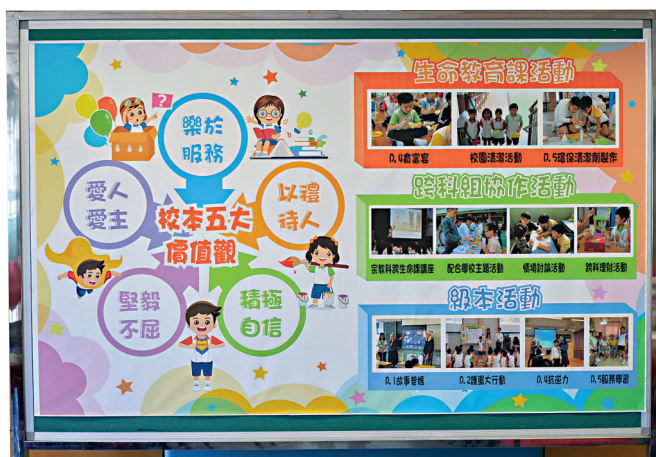
▲生命教育課的報告板除了介紹校本五大價值觀外，還會刊登曾舉辦活動的照片。

陳老師表示：「學校安排星期五課後有一小時『級本活動』，作為生命教育課的延伸。在教學上，我們着重學生的『情感記憶』，透過不同活動營造實踐機會，讓學生感受、體驗正確的行為和價值觀的判斷，實踐『知情意行』。例如『護蛋大行動』中，二年級學生的任務是好好保護獲派的雞蛋，藉此學習愛惜生命。」