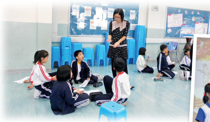
◀學生在生命教育總結課反思自己的學習方法及調整目標。