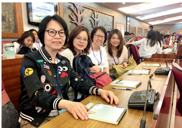
▲教師參加生命教育交流團，觀摩台灣當地如何推行生命教育。

我們在每次生命教育課後透過文字、繪圖及設計短劇等形式讓學生進行回顧，通過每個學期末的總結課，讓學生自我反思及調整學習方法和目標。同樣地，我們也十分重視學生的回饋，以反思教學成效，更重要的是從中了解學生的發展需要。因此，生命成長組的教師定期檢視課程及調適各級學